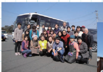
南相馬市鹿島区 小池小草応急仮設住宅で小池小草の皆様と

震災後の5年間の「南相馬仮設住宅土日広島お茶会サロン」の活動でつながりのできた南相馬の人々と継続して友好を深めています。知りえたふくしま南相馬の現状をひろしまのみなさまに伝えます。そして広くサポーターを増やしていきます。