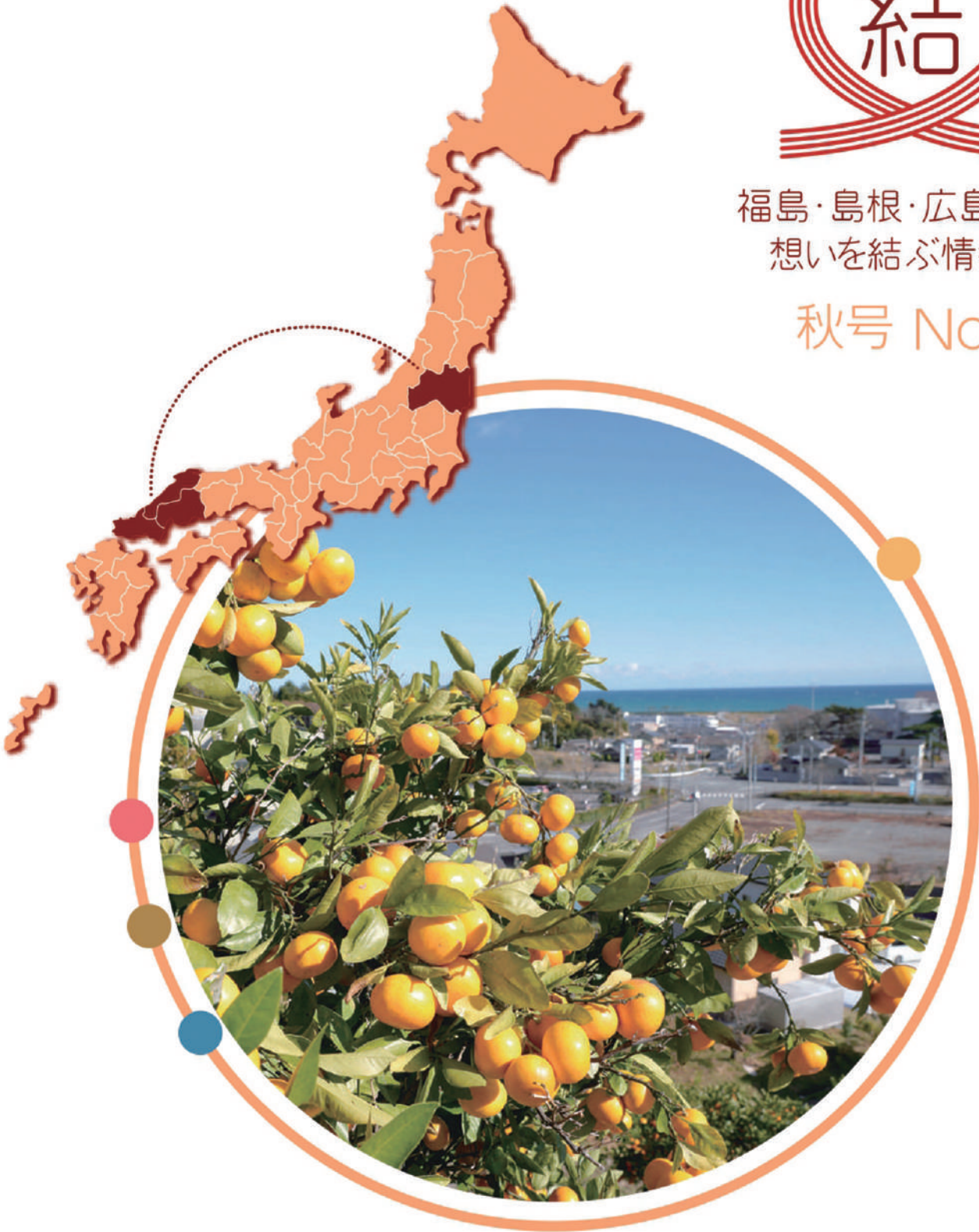
写真 みかんの丘(福島県広野町)