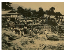
大正時代の復旧風景 (住民が目にする集会所揭示版より)

山本地区は大正 15(1926年)に死者24人の甚大な災害を経験され、工兵隊や奉仕団の支援で応急復旧したものの昭和3(1928)年の豪雨で再び被災し、当時の山本村村長が率先して河川改修等に取り組みられた記録が災害史に残されています。