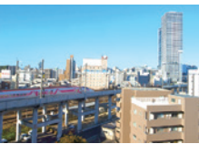
ホールや和室の窓からは、新幹線がよく見えます。

当地区の大半は、昔は海でした。中山地区には縄文時代後期から弥生時代中期の貝塚も発見されています。尾長天満宮は、菅原道真が九州大宰府に下る途中に舟を寄せて休息したといわれる所です。「尾長」の地名も嵐の夜に沖を通る舟が難破した時に、大蛇が長い尾で救ったことからつけられたという言い伝えもあります。