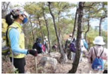
二ヶ城山から市内を望む

4年前の西日本豪雨で大きな災害にあった馬木地区ですが、公民館活動グループや地域団体のご尽力で、自然を満喫できる幸せを日常的に感じることができるようになりました。ぜひ馬木の自然に触れてみてください。