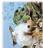
モリアオガエルの産卵