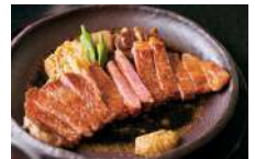
比婆牛のステーキ