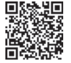
▲三矢の里あきたかた HP