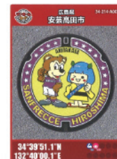
サンフレッチェ広島 コラボマンホールカードもゲット出来る！