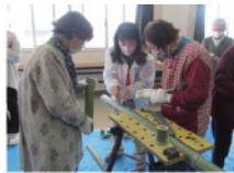
黄金山の竹材活用

黄金山の山すそに家並みが並ぶ路地を歩いていると、かつての広島湾の海岸線の岩礁などを見ることが出来ます。埋め立てにより現在は風景が一変していますが、何人かの写真家や民俗学者、画家がこの土地のイメージを留める作品を残しています。公民館でも歴史を掘り起こす講座が人気を博しています。