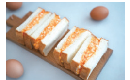
高級食パン「美味しくて、悔悔。」を使った濃厚玉子サンド。手土産にも◎！！